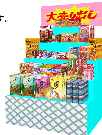
3D表示で表現力が向上します。

まだまだ多くのバージョンアップ項目がありますが、詳しくはフォーラムでご説明いたします。